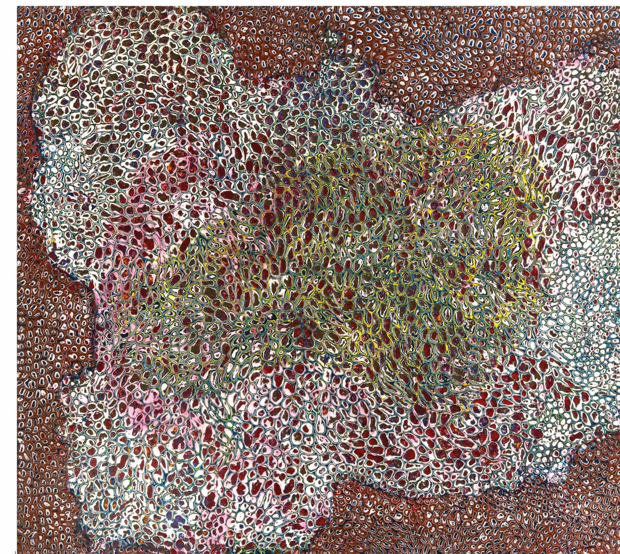
PNEUMA I enakustyka na płótnie, 100x90 cm, 2020.

Wernisaż wystawy 27 kwietnia 2024 r. godz. 18.