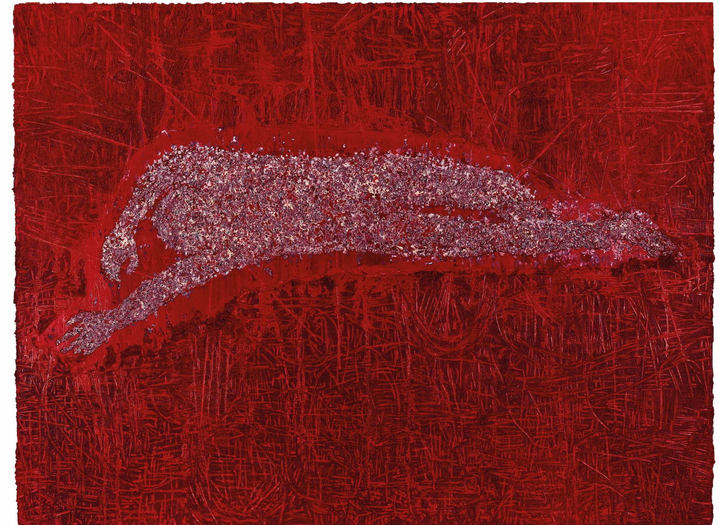
ZABLIŻNIANIE olej, pigmenty, enkaustyka na płótnie, 150x200 cm, 2012-20.