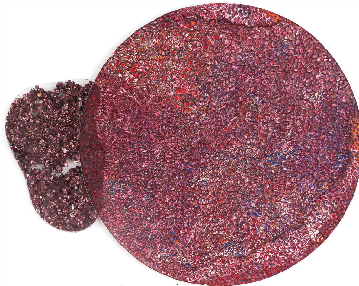
NIEZNOŚNA PORPHYRA enkaustyka na płótnie, obiekt z plexi niewymiarowy, ø 100 cm, 2021.