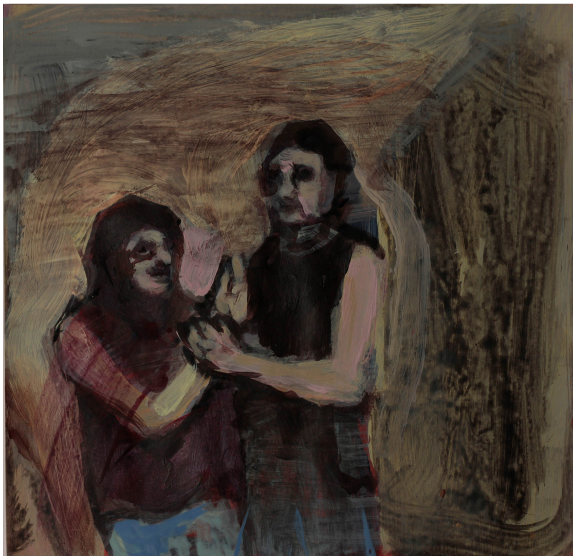
straż, 20x21 cm. akryl na papierze