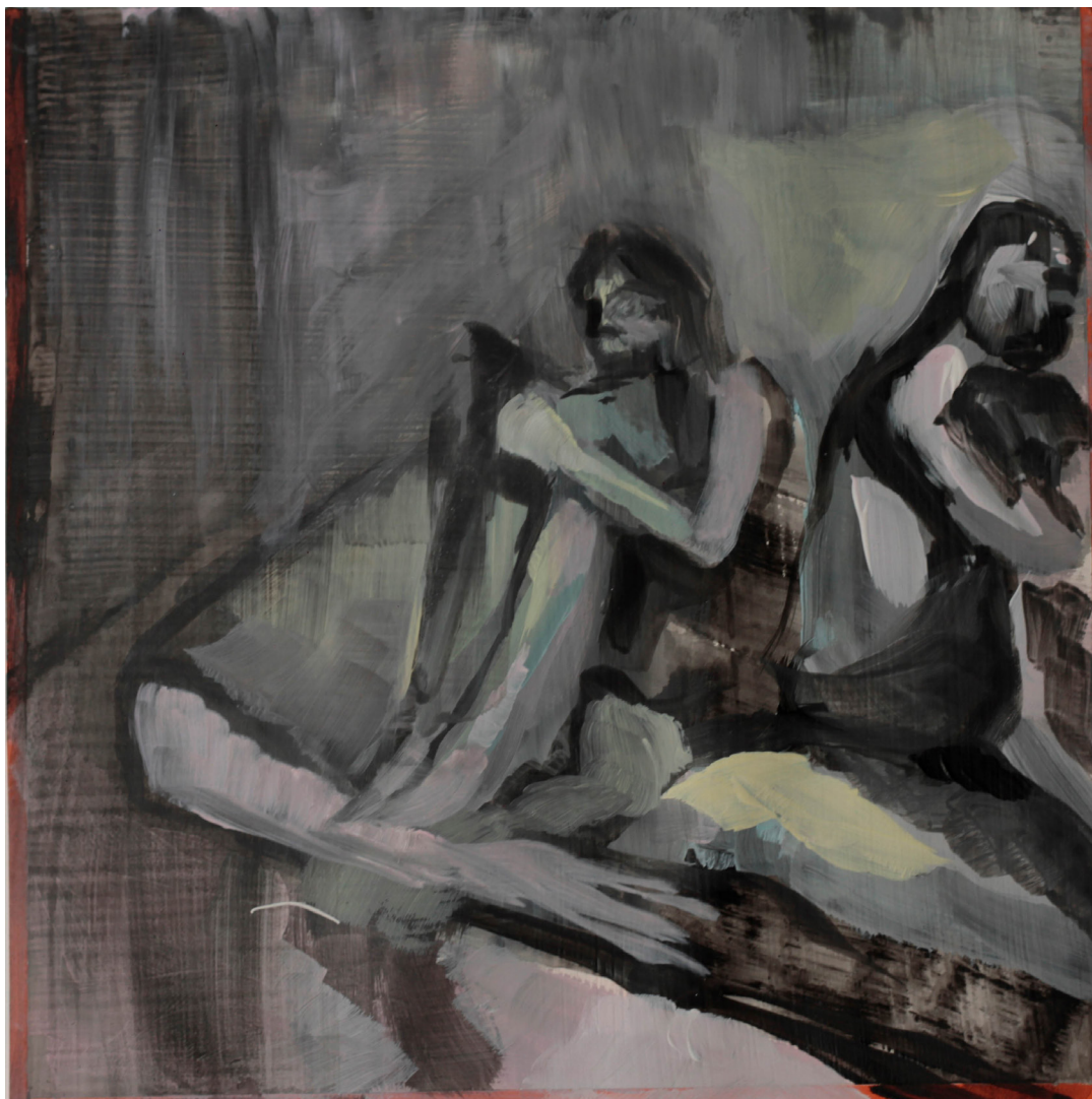
dwa światy, 21x21 cm. akryl na papierze