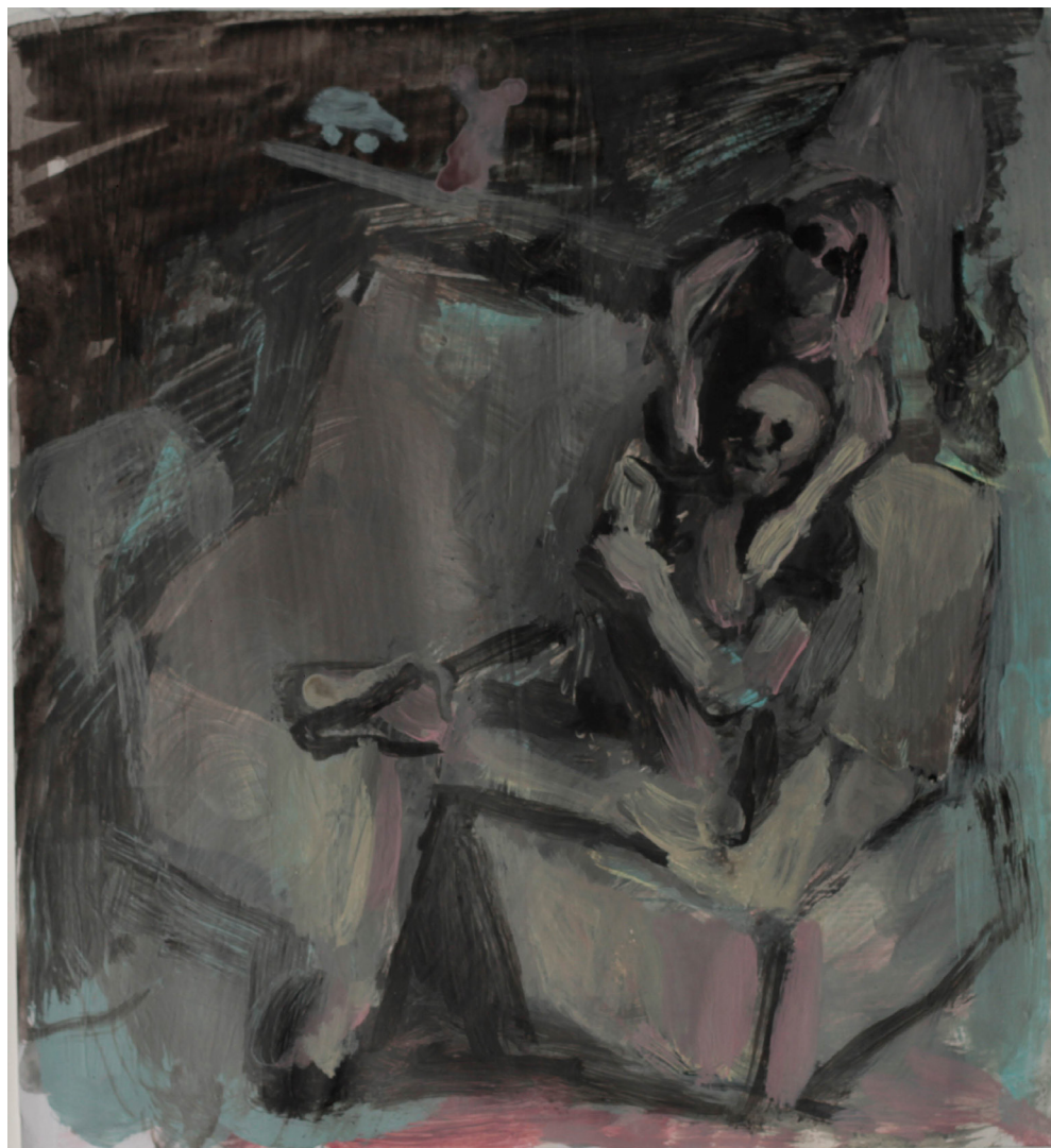
moment uwagi, 23x21 cm. akryl na papierze