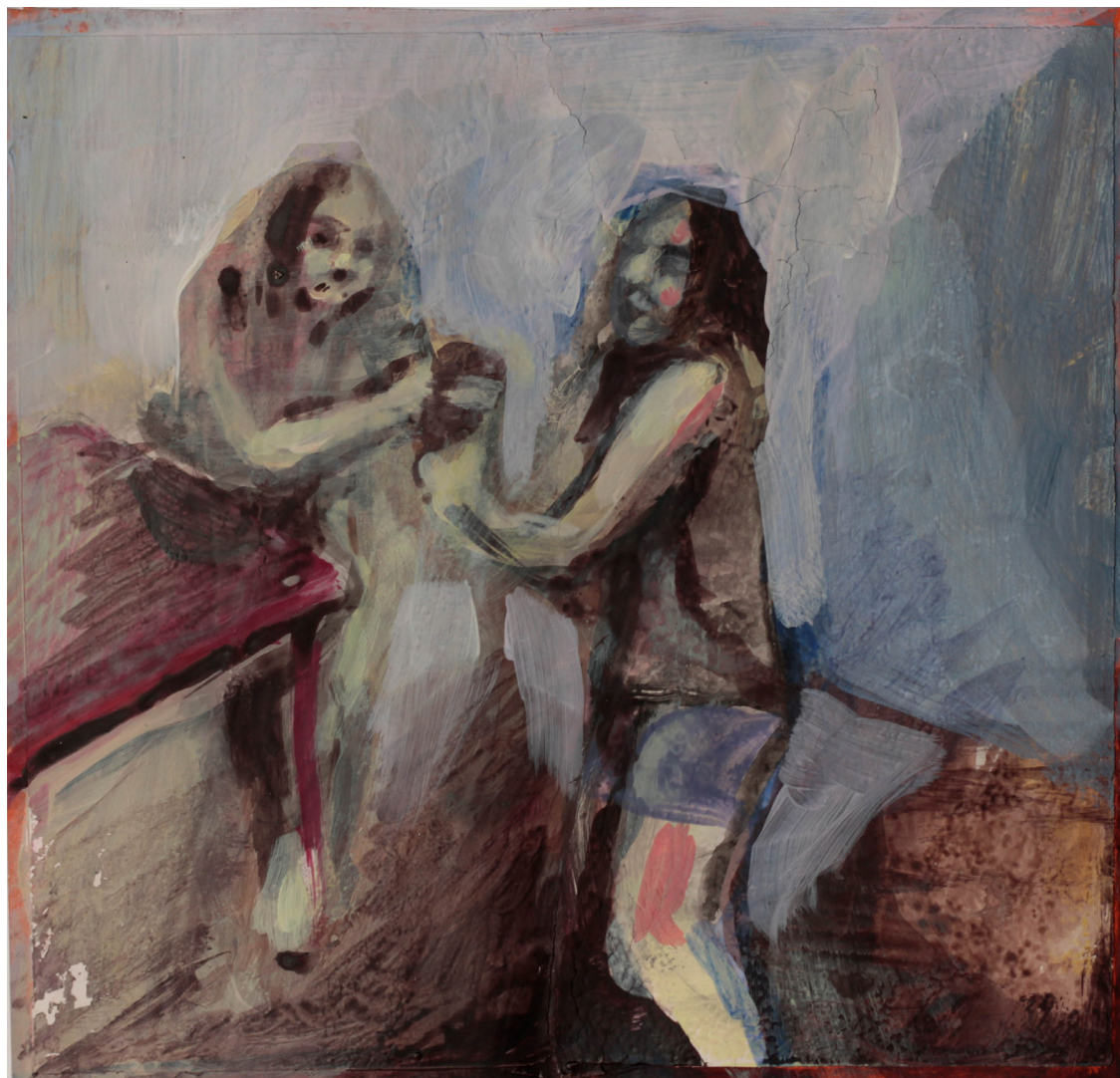
obowiązki, 20x21 cm. akryl na papierze