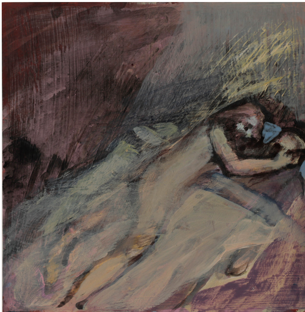
czuwanie, 21x21 cm. akryl na papierze