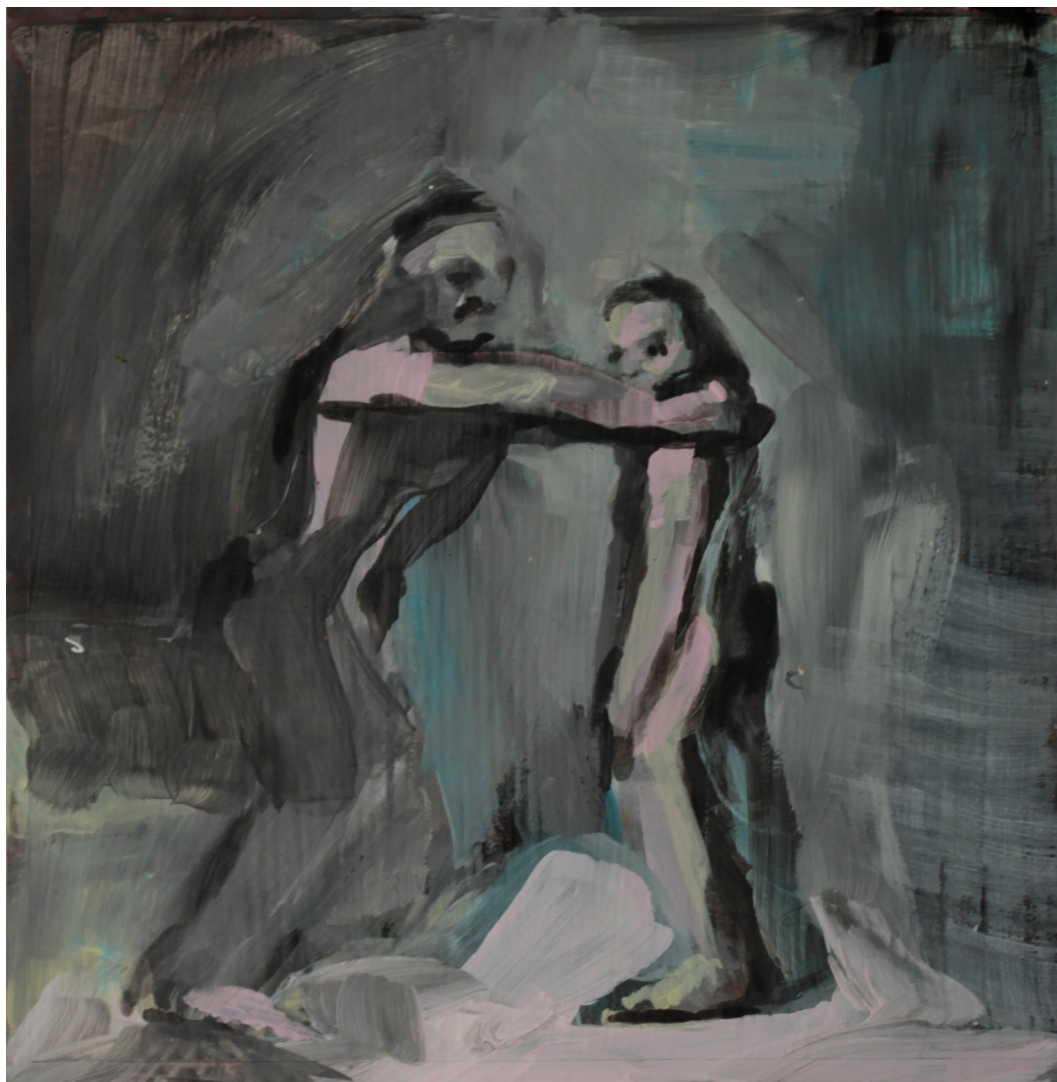
pierwsza lekcja, 21x21 cm. akryl na papierze