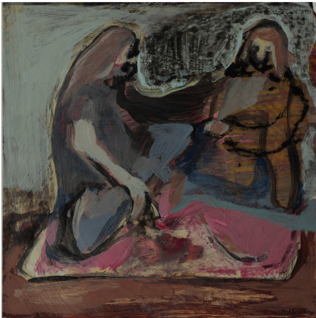
herbatka, 21x21 cm. akryl na papierze