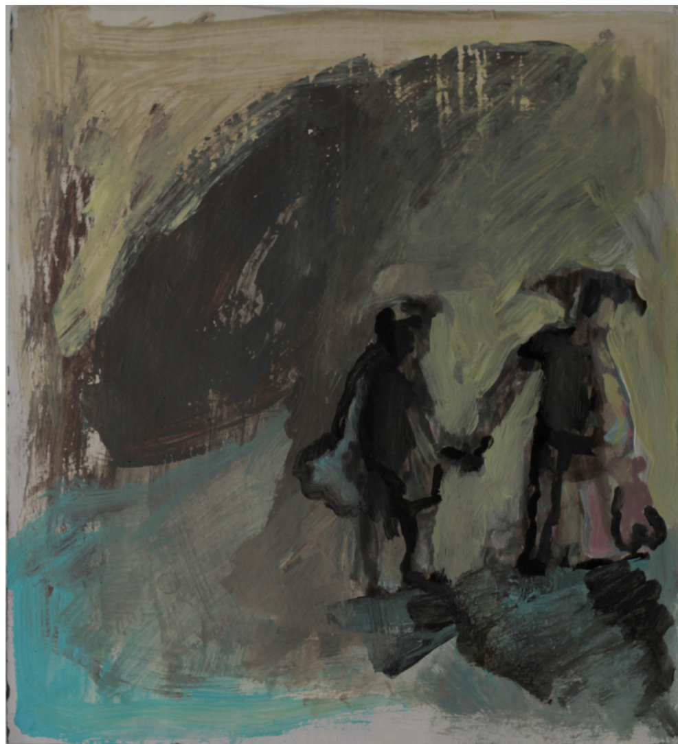
budowanie, 23x21 cm. akryl na papierze