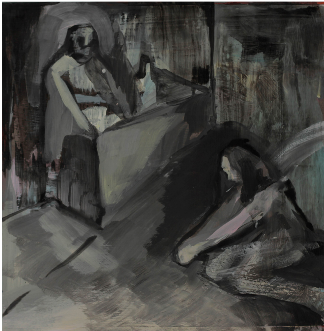
mównica, 21x21 cm. akryl na papierze