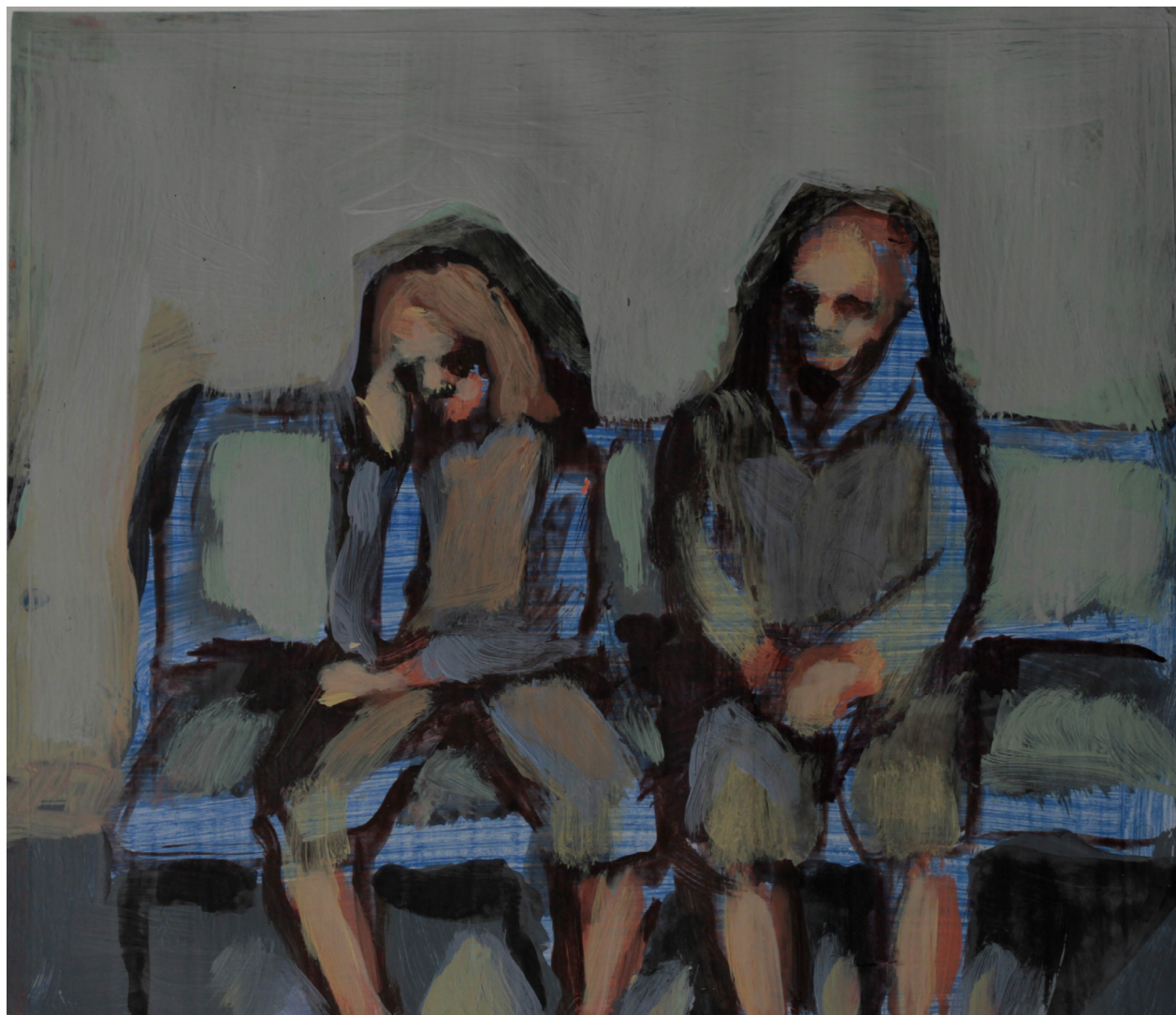
plan b, 18,5x21 cm. akryl na papierze