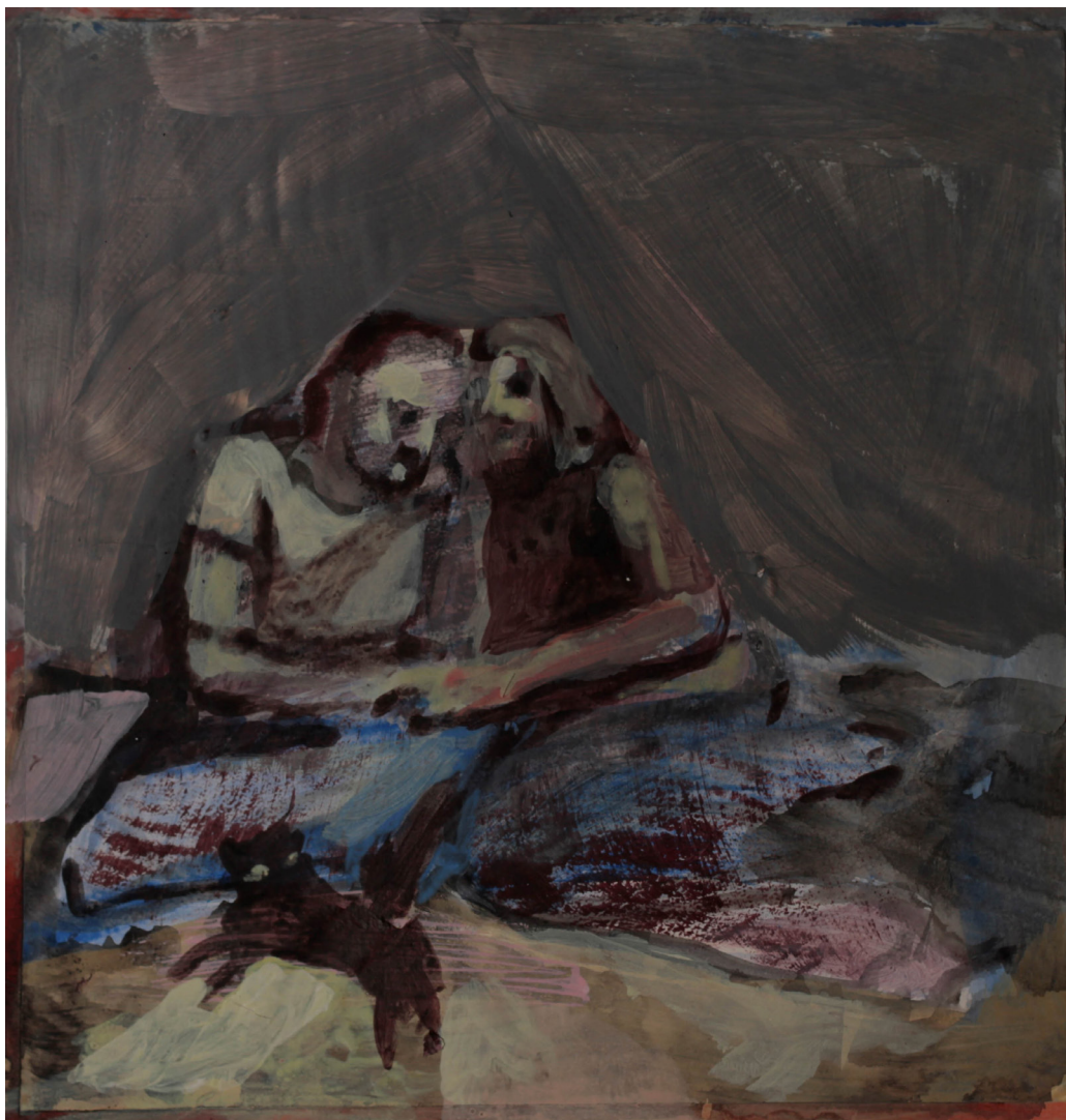
opiekunowie, 21x21 cm. akryl na papierze