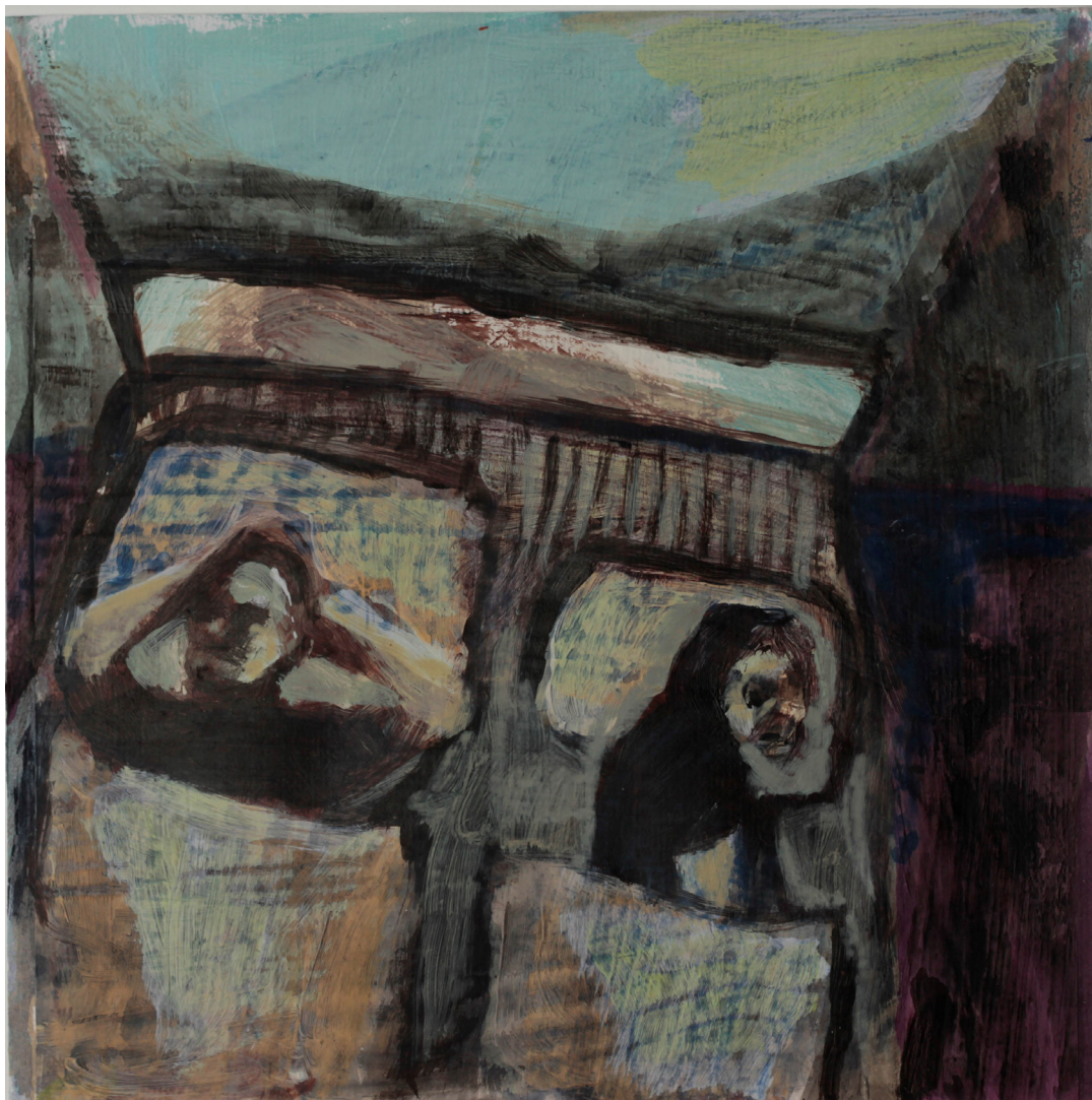
pomiędzy nami, 21x21 cm. akryl na papierze