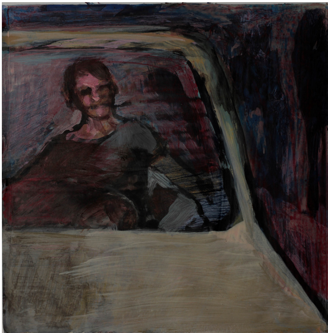
chwilę przed, 21x21 cm. akryl na papierze