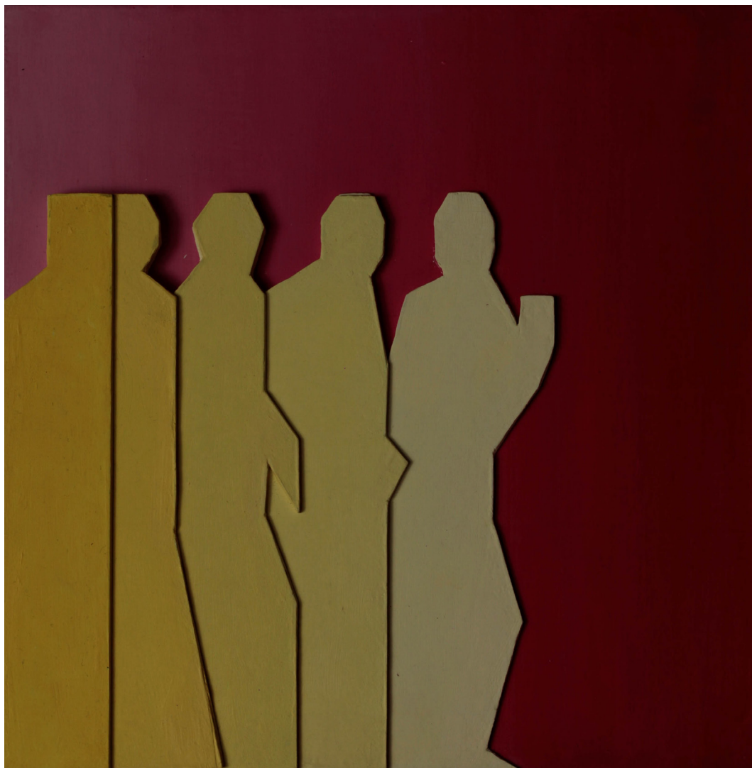
relief, 25x25cm akryl na tekturze