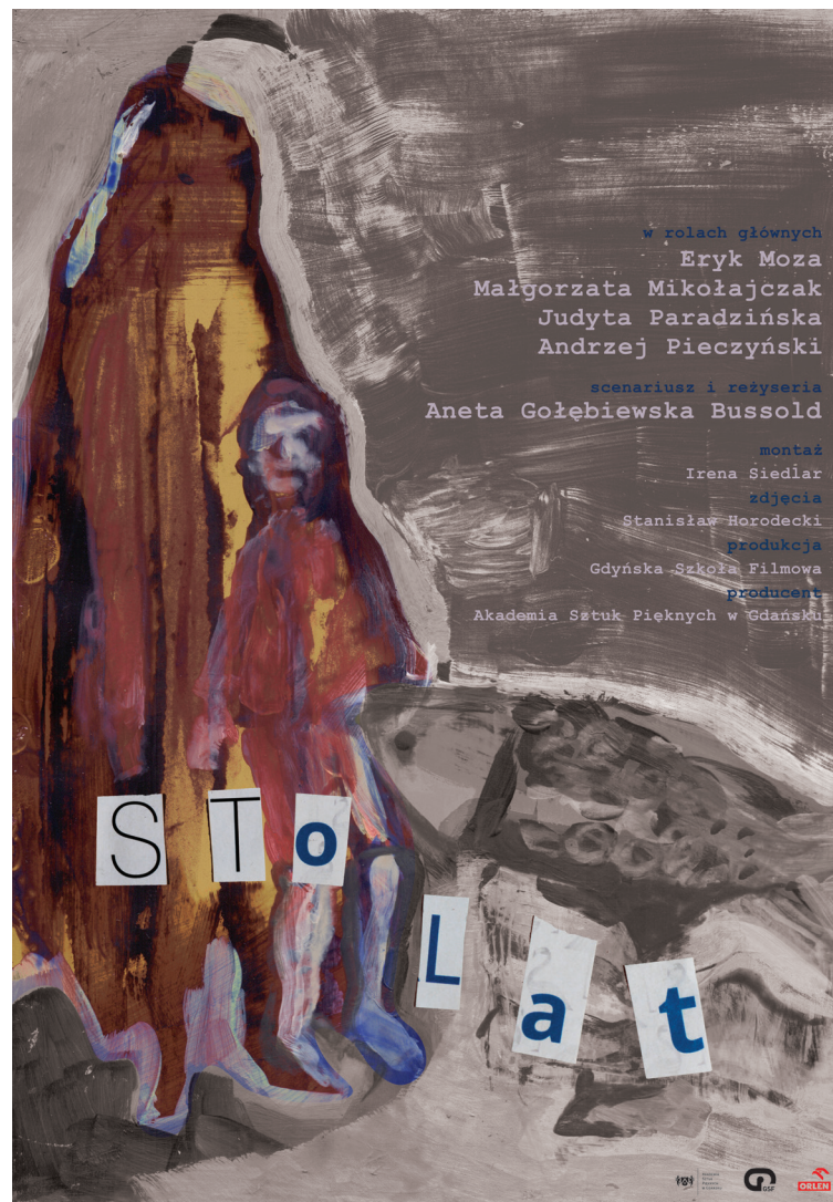
plakat do filmu 100 lat, 100x70 cm.