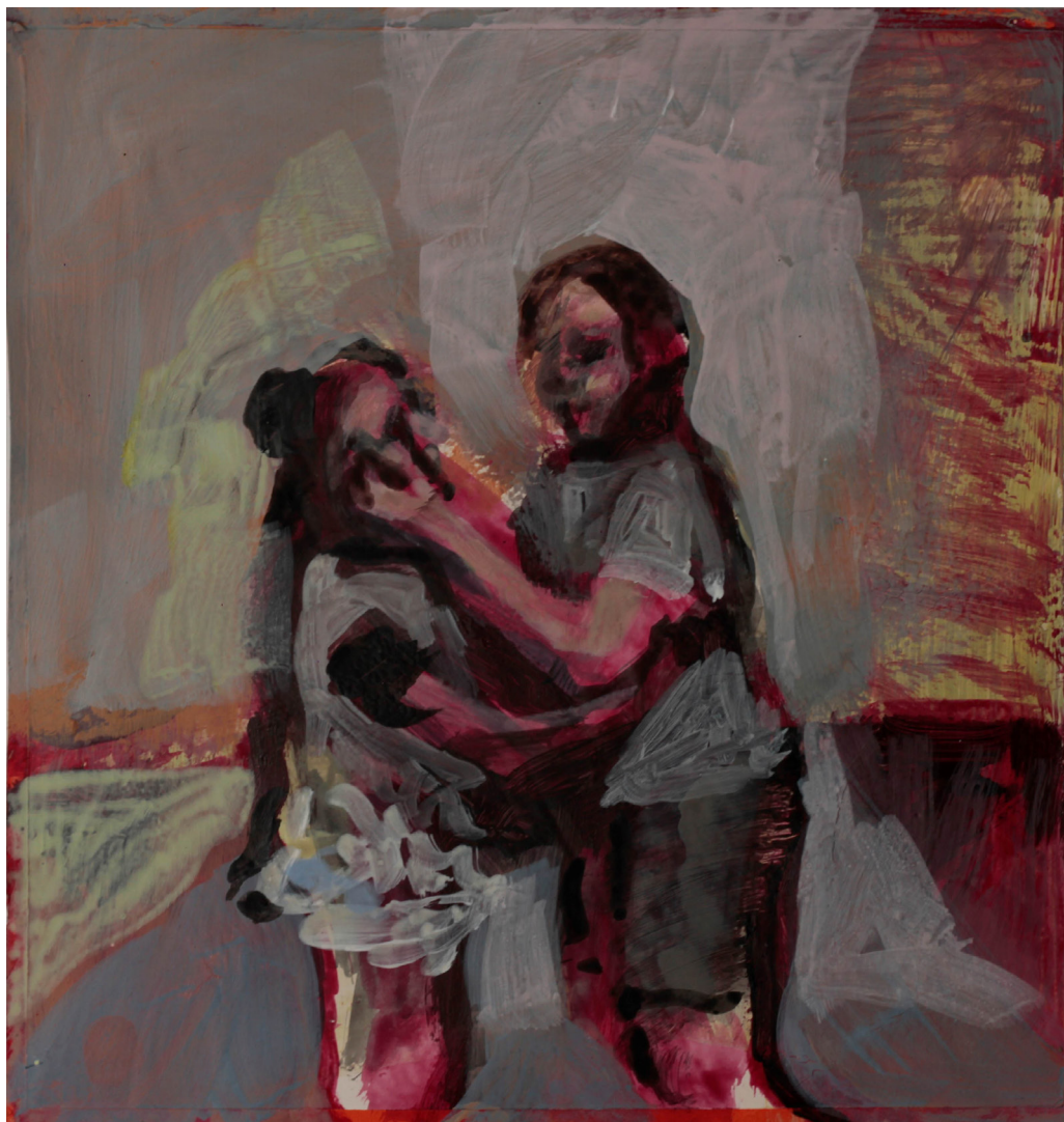
ostatnie lub pierwsze, 21x21 cm. akryl na papierze