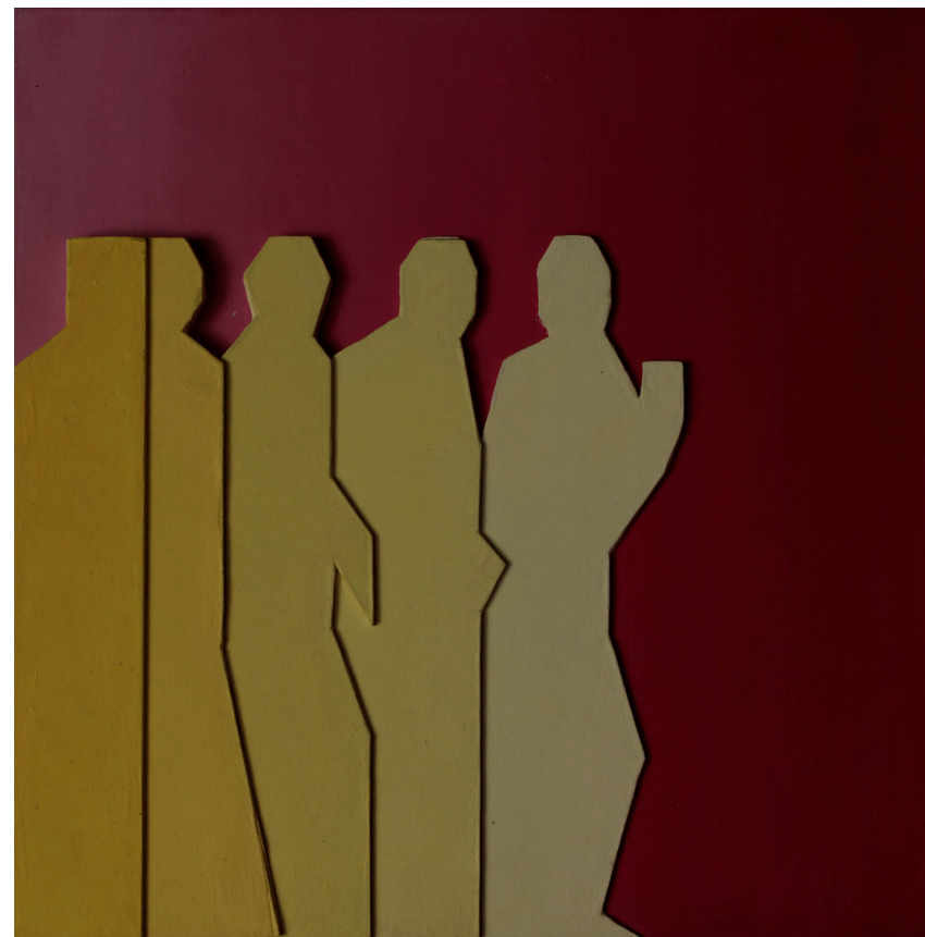
relief, 25x25cm akryl na tekturze