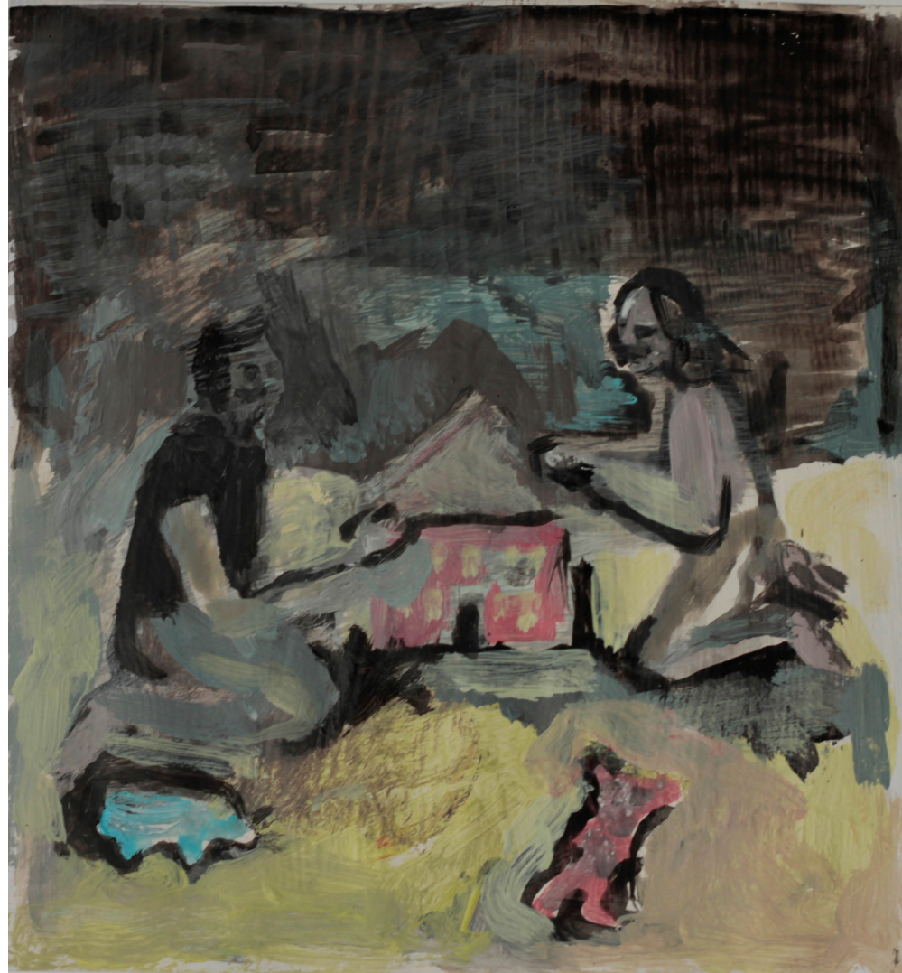
zabawa w, 23x21 cm. akryl na papierze