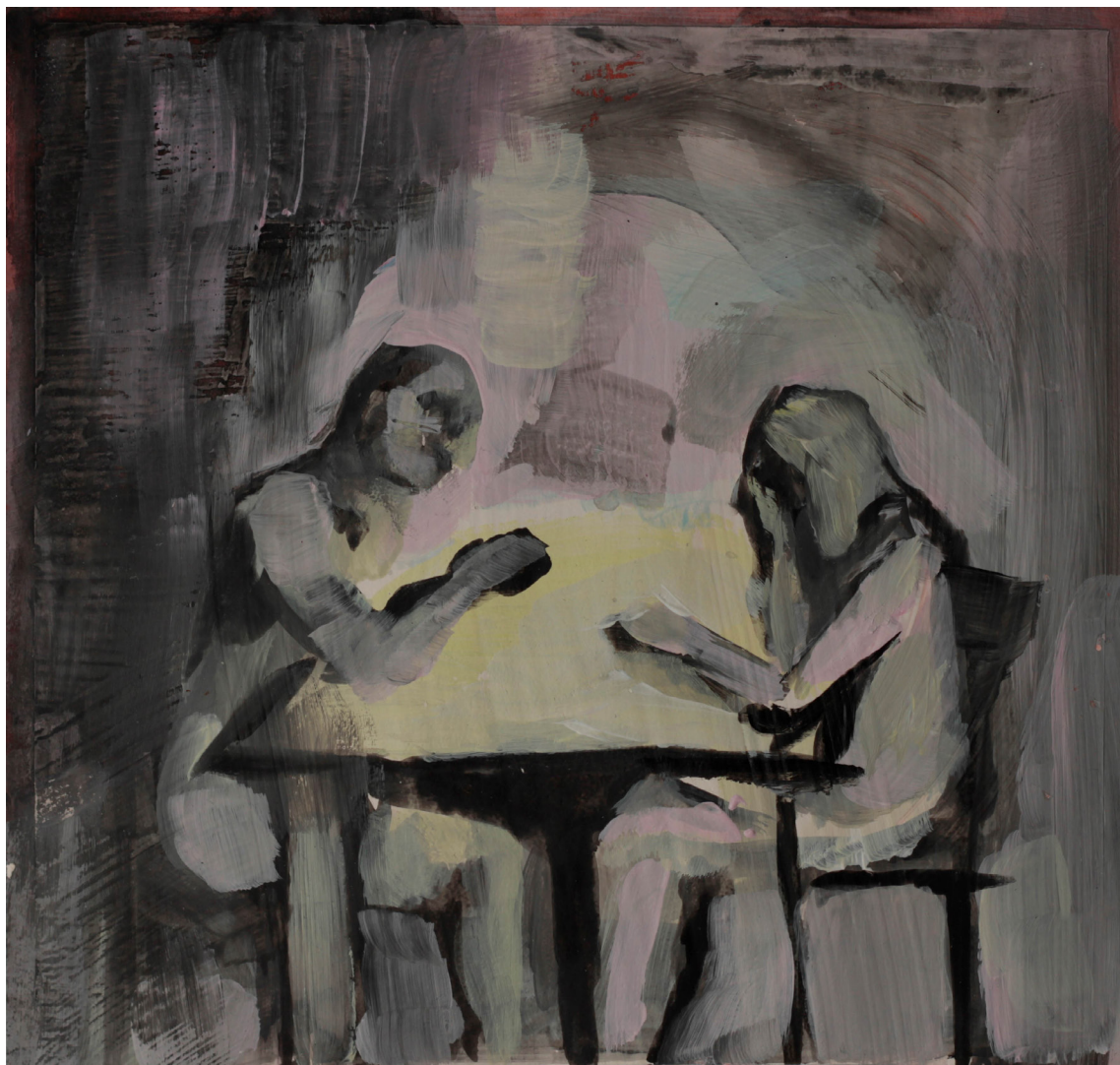
przesłuchanie, 21x21 cm. akryl na papierze