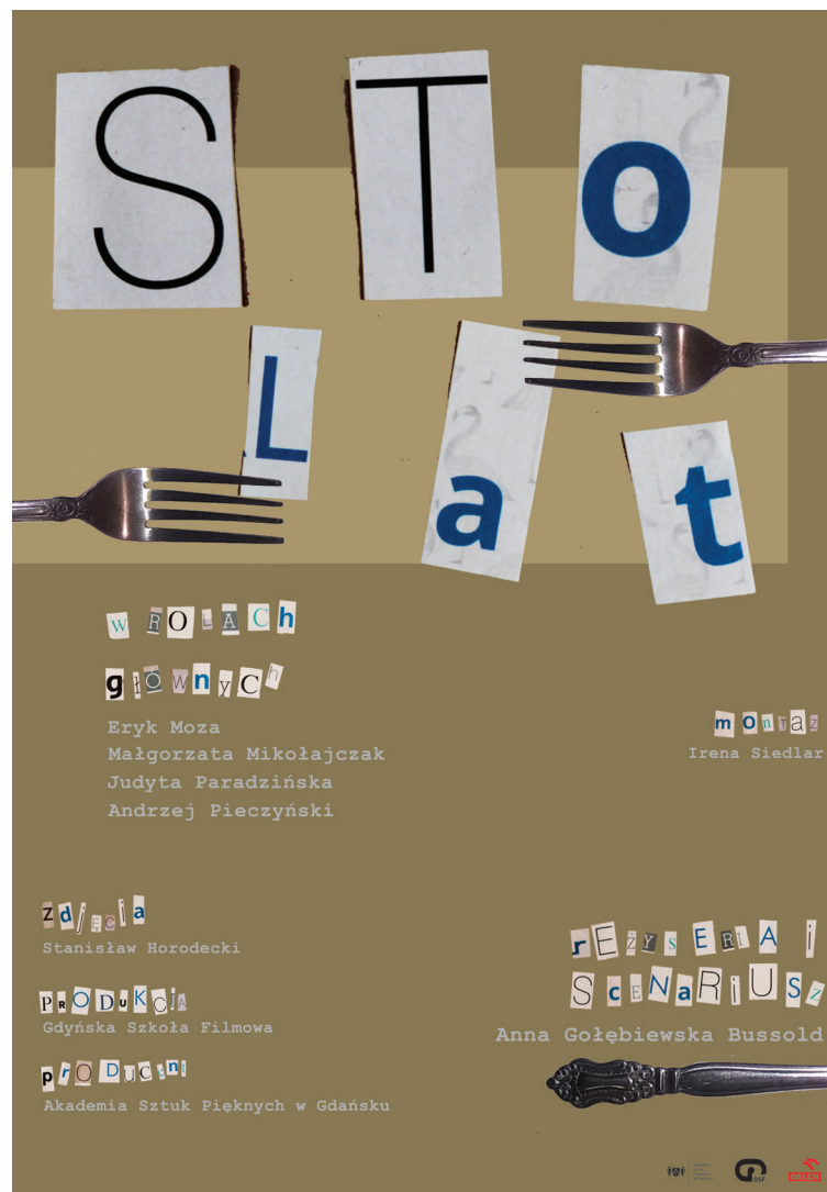
plakat do filmu 100 lat, 100x70 cm.