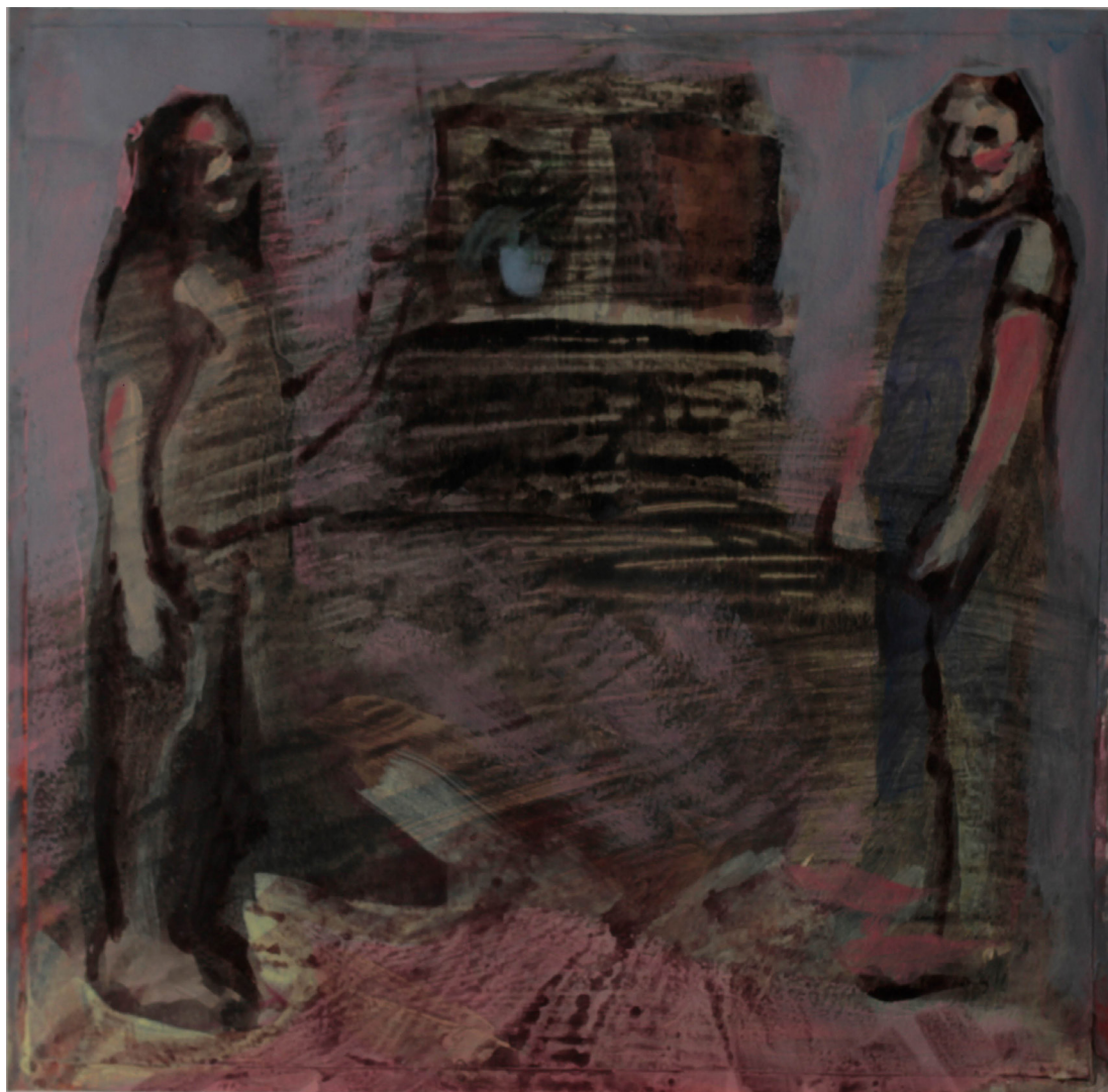
porządkowanie, 20x21 cm. akryl na papierze