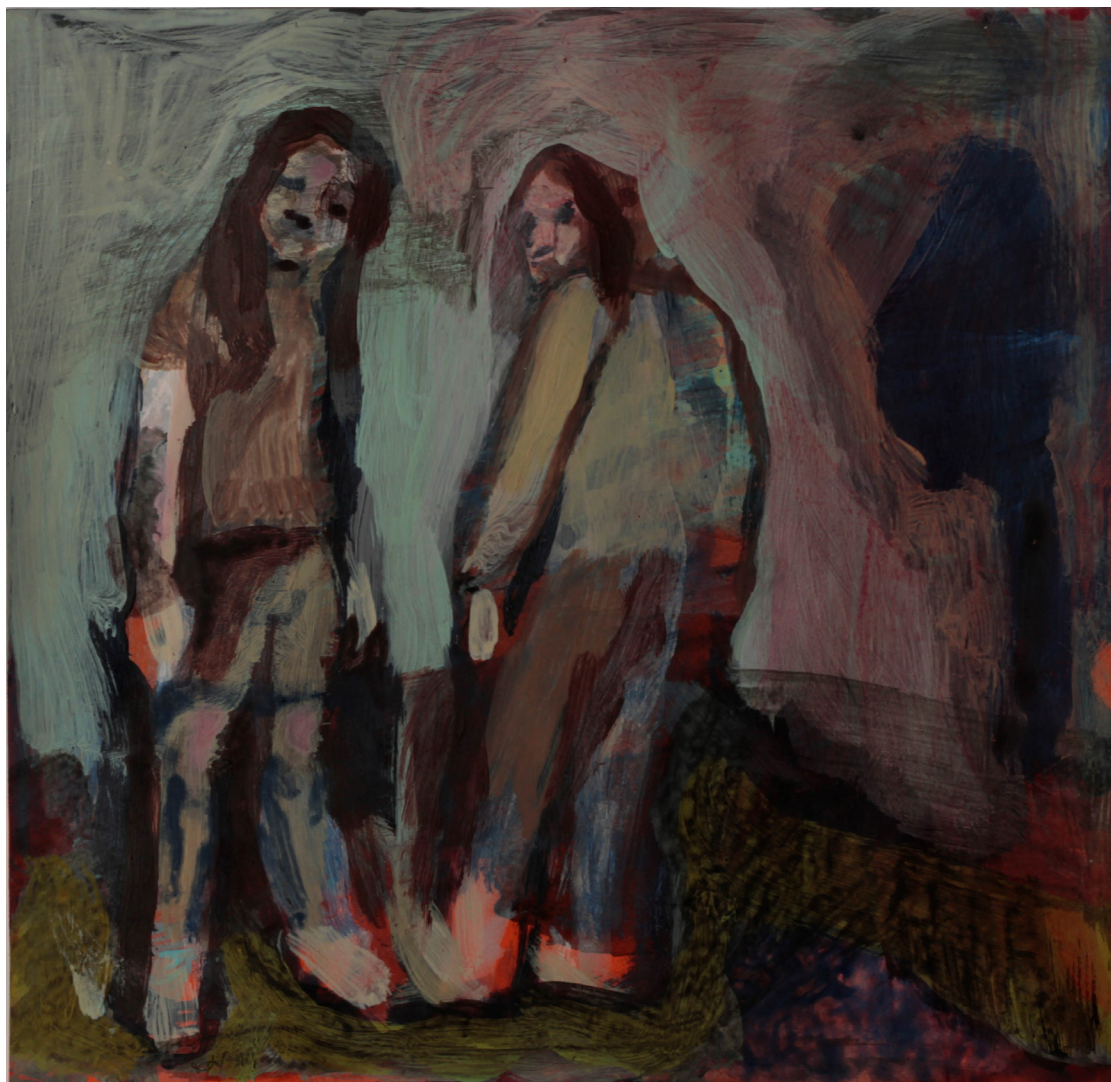
zagrożenie, 20x21 cm. akryl na papierze